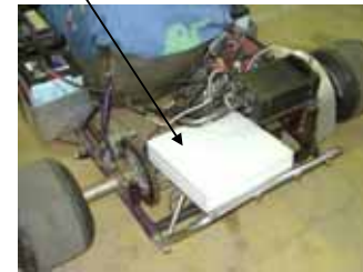
Driver fittings ドライバへのケーブル装着