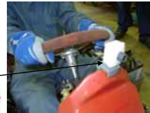
Camera, Driver's Eye 前方カメラ