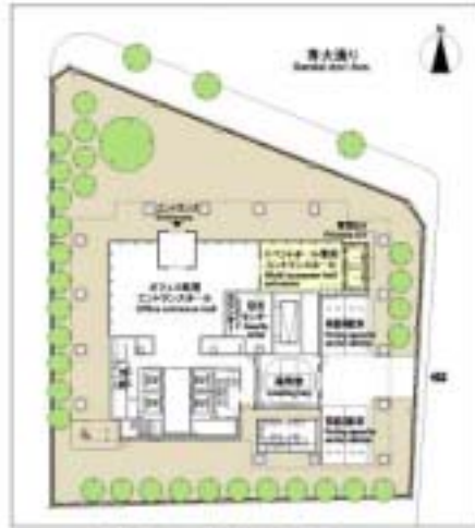
1階平面・敷地配置図 1st floor plan